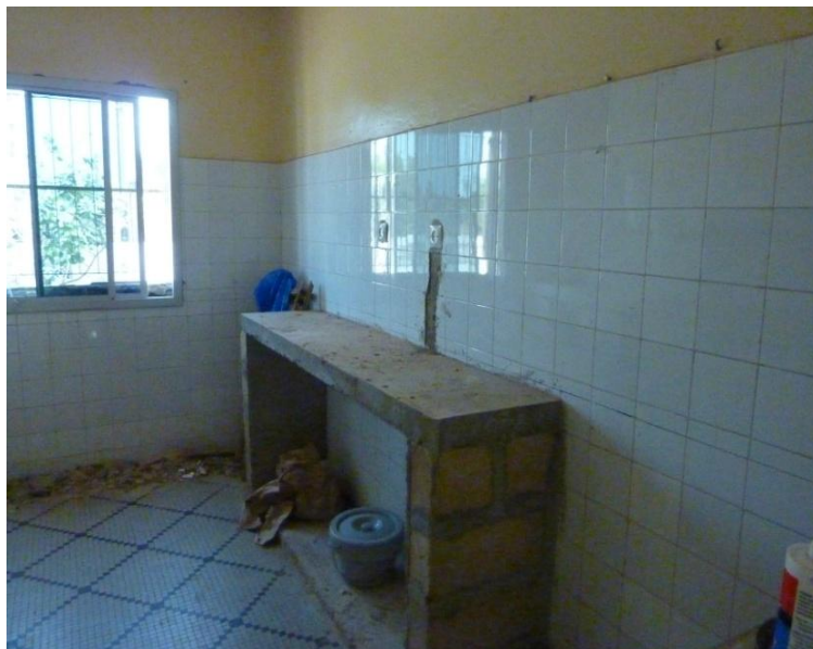
Le labo de Sébikotane en travaux

Restent les jardins. Ba et Balankine sont loin de répondre aux attentes, soit parce que le premier est géré par des commerçants et non des maraîchers, ceci expliquant cela, le second, parce que les équipements sont laissés à l'abandon. Heureusement, il en va autrement des jardins d' Elogogne , de Bougoutir et Kafanta (ce dernier non soutenu par MAP), visités par nos voyageurs. Quant à celui de Tangane , il faut songer à en réduire la moitié de l'exploitation pour qu'il devienne opérationnel.