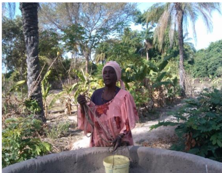
Jardin des femmes de Thionck Essyl

Enfin, en ce qui concerne le Sénégal , il est à déplorer que la somme de 1290 euros allouée sous forme de micro-crédit est « perdue à tout jamais » et que le conflit Tafa-Lamine continue d'empoisonner le bon déroulement des choses.