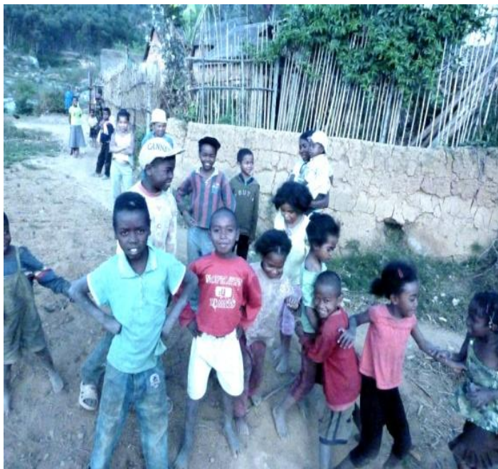
Des enfants parrainés

Nous avons évoqué les parrainages de Madagascar (54 enfants parrainés) et avons dit la satisfaction de constater qu'il s'agissait là d'un secteur qu'il faut consolider et même amplifier au vu des résultats obtenus. Toutefois, nous déplorons le peu de personnes répondant à nos convocations aux