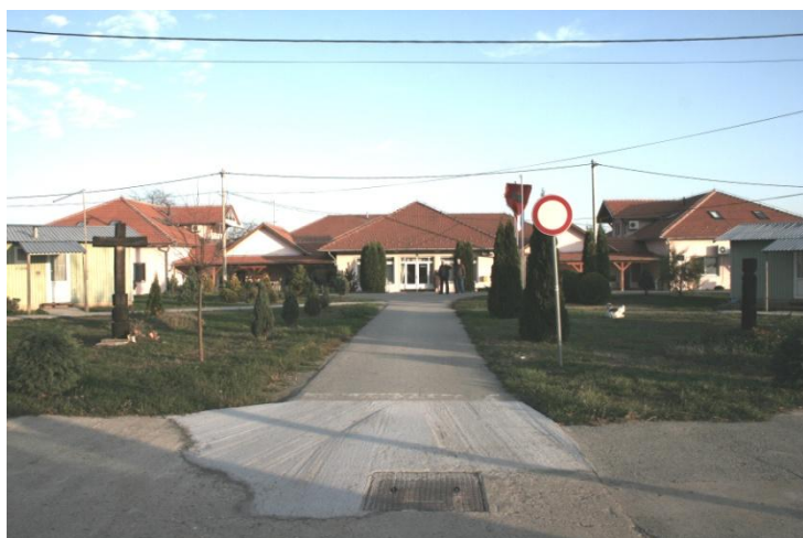
Entrée de la maison de retraite de Ilok