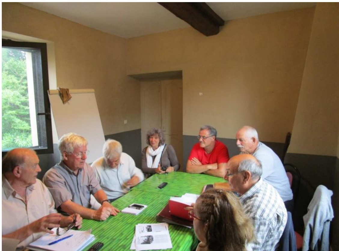
Les membres du CA en réflexion intense