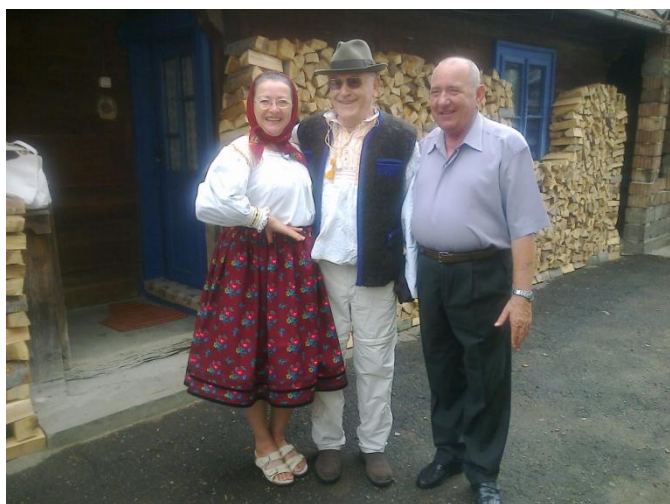
Notre président en habit local

Après un voyage-éclair en camionnette du 5 au 8 avril et la livraison à Timisoara